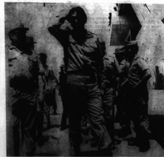
"El MRTA se ha refundido pero no tiene una definida concepción marxista, marchando así a servir al imperialismo, al socialimperialismo y al supuesto diálogo fascista al cual ya le han dado treguas unilaterales".

"El Presidente Gonzalo ha establecido llevar adelante una guerra popular unitaria"