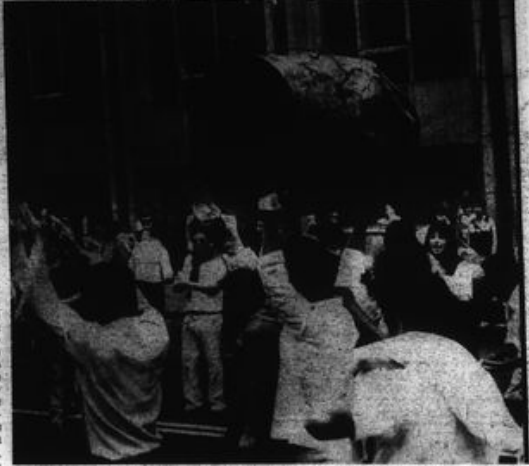
"Es con violencia revolucionaria que nuestro pueblo conquista reivindicaciones, derechos y libertades, pues nada le cayó del cielo ni le fue dado".

dades no se construye el nuevo Poder, Base de apoyo, sino Frente concretado en Movimiento Revolucionario de Defensa del Pueblo con Centros de Resistencia que hacen la guerra popular y preparan la futura insurrección, que se dará cuando las fuerzas del campo asalten las ciudades en combinación con la insurrección desde dentro.