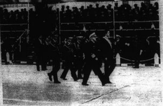
"Alan García continúa la política contrarrevolucionaria de su antecesor buscando aplastar la guerra popular".

Dentro del Plan de Conquistar Bases se ubica el "Plan del Gran Salto" que sujeta a la estrategia política específica de "dos repúblicas se expresen, dos caminos, dos ejes" y a la estrategia militar de "generalizar la guerra de guerrillas", ha plasmado cuatro campañas exitosas bajo las guías políticas de "Abrimos campo político", "Contra las acciones generalistas del 65, entrabándolas, huyendo de Ayacucho, las ahí donde nos fuera factible", "Contra la asunción del nuevo gobierno aprista" y "Socavar el montaje fascista y corporativo aprista". La guerra popular se desarrolló en la región de Ayacucho, Huancavelica y Apurímac y se expandió a Pasco, Huánuco y San Martín, cubriendo un ámbito desde el departamento de Cuzco, en la frontera con Ecuador, en el noroeste, hasta Puno en la frontera con Bolivia en el sureste del país; golpeando y remeciendo en las ciudades, especialmente en la Capital.