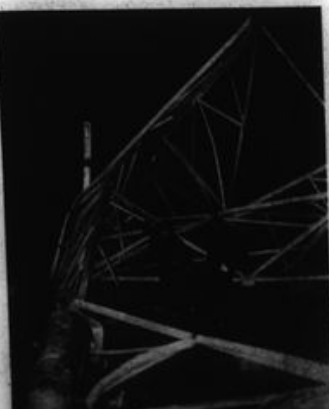
Las voladuras de trenes de alta tensión, son acciones que desarmamos al POC y los desarmamos en el tiempo en el cual los defectos del enemigo se acrecientan y se acrecientan más los nuestros, cuando surgen los más