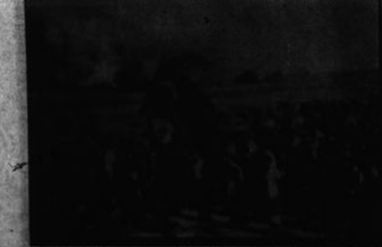
"Construcción de las fuerzas armadas revolucionarias, especificadas en Ejército Guerrillero Popular, que tiene como particularidad la incorporación de la milicia para avanzar hacia el mar armado de masas."

La línea militar son las leyes que rigen la guerra popular para la conquista del Poder y la defensa del mismo.