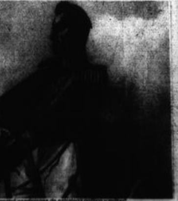
Bolívar demostró condiciones de estratega político y militar.

En la República seguían manteniendo los tratenamientos pero enfrentando a sangre y fuego grandes luchas campesinas, entre ellas la de Atusparia y Uscho Pedro o la de Llacolla en Orcos. Aquí leemos el negro capítulo de la guerra con Chile donde se