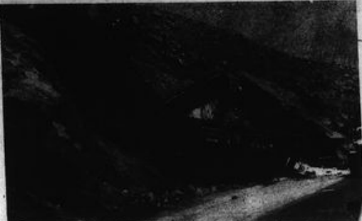
El desarmamiento de trenes, entre otras acciones, son parte de las formas de lucha de los guerrilleros del PCP.

"Las fuerzas armadas en el Perú nunca han ganado guerras y son expertas en derrotas".