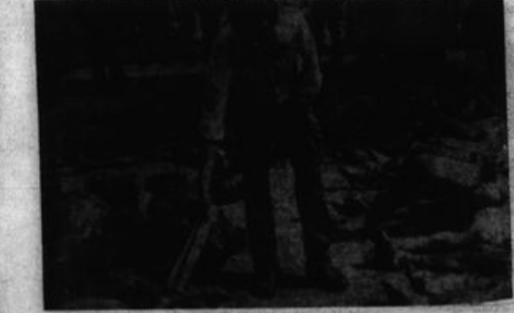
Genocidios como los de Acomarca, Llocllapampa, Umanu, Bellavista, forman parte de la política contrarrevolucionaria del gobierno aprista que busca aplastar la guerra popular.

En conclusión, yendo a los ocho años de guerra popular hemos cumplido más de cuarenta y cinco acciones que revelan alta calidad de las acciones; el Partido militarizado se ha templado; el Ejército Guerrillero Popular se ha desarrollado y aumentado su belicosidad; y, tenemos cientos de organismos de nuevo Poder y las masas más pobres nos apoyan cada vez más. La guerra popular ha elevado la lucha de clases de nuestro pueblo a su forma